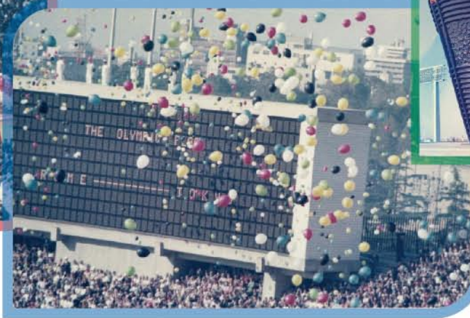
1964年東京 オリンピック開会式