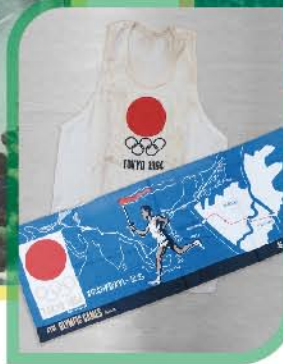
1964年東京オリンピック開会式