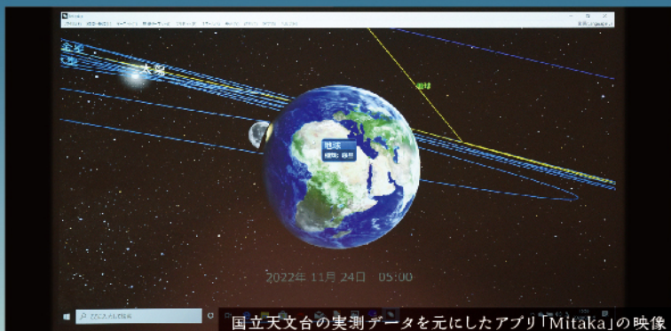
国立天文台の実測データを元にしたアプリ「Mitaka」の映像