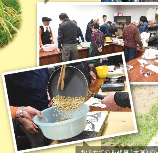
炒りたてのあぜ豆(大豆)の料理も！