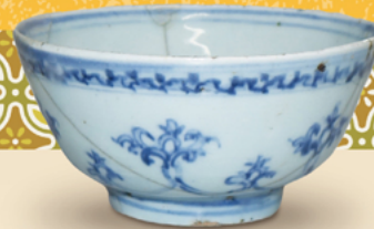
中国産の染付碗(葛西城址出土) 当館所蔵