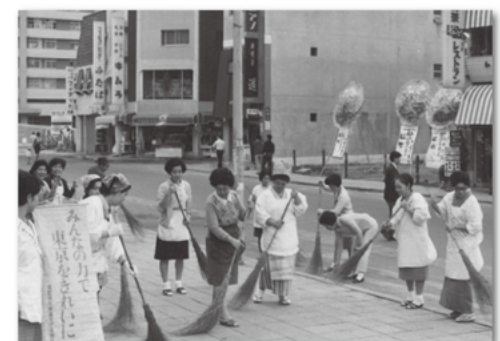
東京オリンピック開催のために 東京をきれいにする運動(1964年)