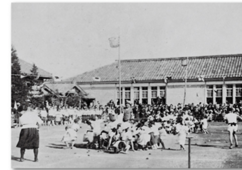
水元小学校運動会(大正14年～昭和初期)

なお、にこわ新小岩では「『キャプテン翼』と11人のエピソード展」が行われます。こちらも併せてぜひご覧ください。