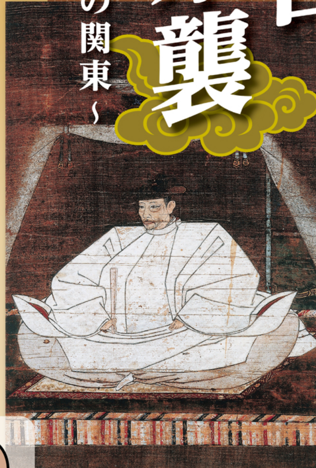
豊臣 秀吉肖像画 佐賀県立名護屋 城博物館所蔵

会期 令和7年 11月22日(土)～ 令和8年 1月18日(日) 会場 当館2階特別企画展示室