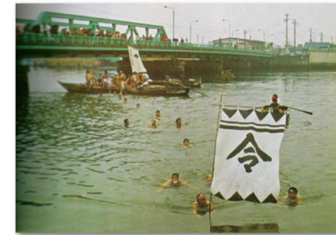
本奥戸橋での寒中水泳大会(昭和30年代～40年代)