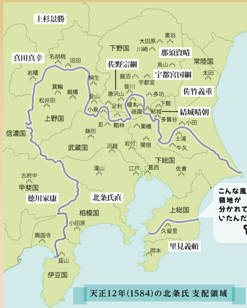
天正12年(1584)の北条氏 支配領域

本展示では、16世紀後半の関東における北条氏の勢力拡大指向と、そこに立ち上がる秀吉の動向、さらに天正18年の秀吉と北条氏の攻防にも焦点をあて、秀吉と北条氏の対決をみていきます。