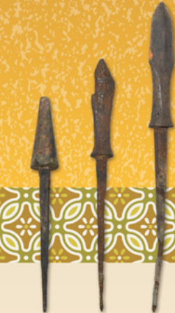
てつぞく 鉄鏃(葛西城址出土) 当館所蔵