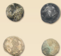
ひなわじゅう だんがん 火縄銃の弾丸(葛西城址出土) 当館所蔵