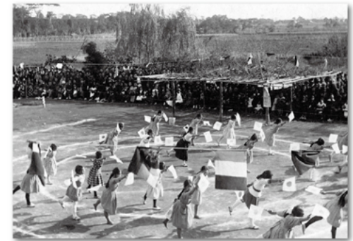
運動会でのダンス(大正13年度)