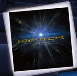
シンフォニー・オブ・ユニバース