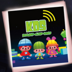
かつしか ドームステーション