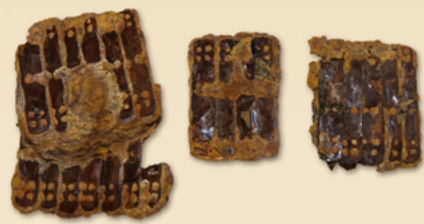
よろい ござね 鍔の小札(山中城跡出土) 三島市教育委員会所蔵