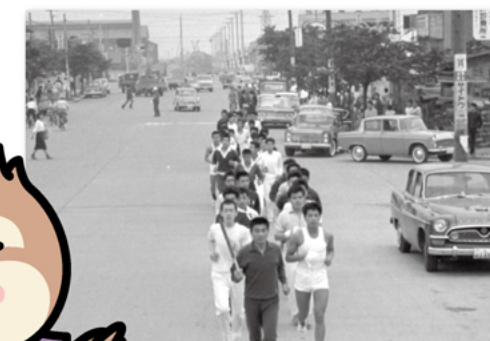
東京オリンピック・パラリンピック 聖火リレーの練習(1964年)