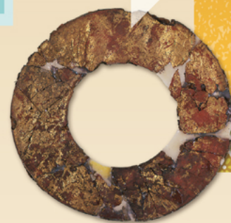
かぶと まえだて 兜の前立(山中城跡出土) 三島市教育委員会所蔵