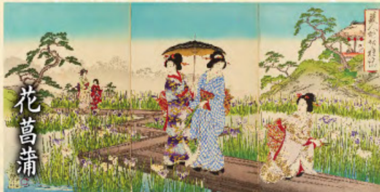
楊斎延一「美人堀切の遊覧」明治28年(1895)