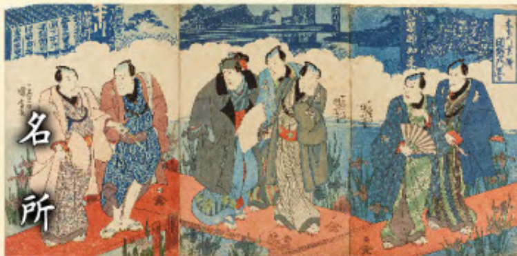
歌川国芳「木下川業師開帳の図」文化12年(1815)

大人だけではなく、多くの子どもたちにも、葛飾区の歴史や文化に興味を持つきっかけとなればと思います。