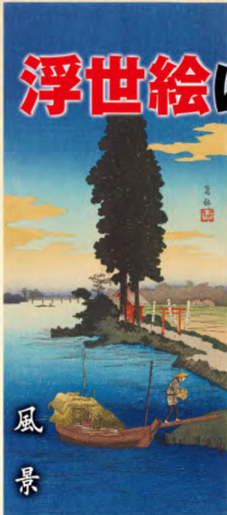
高橋松亭「葛飾」大正末～昭和初期

この企画展では、江戸時代から近代にかけて、葛飾区の美しい自然風景などを題材とした「浮世絵」を展示します。浮世絵は、その時代の葛飾区の様子を知る唯一の絵画資料として、貴重な郷土資料でもあります。ぜひこの機会に、浮世絵に描かれた自然豊かな葛飾区の風景をご覧くださいと思います。