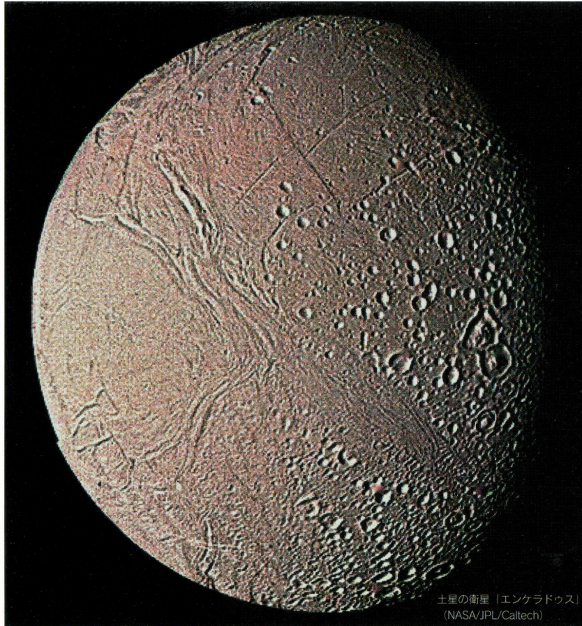
土星の衛星「エンケラドゥス」

〒125-0063 東京都葛飾区白鳥3-25-1 TEL 03(3838)1101