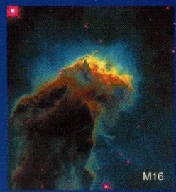
M16 STScI (宇宙望遠鏡科学研究所) 提供