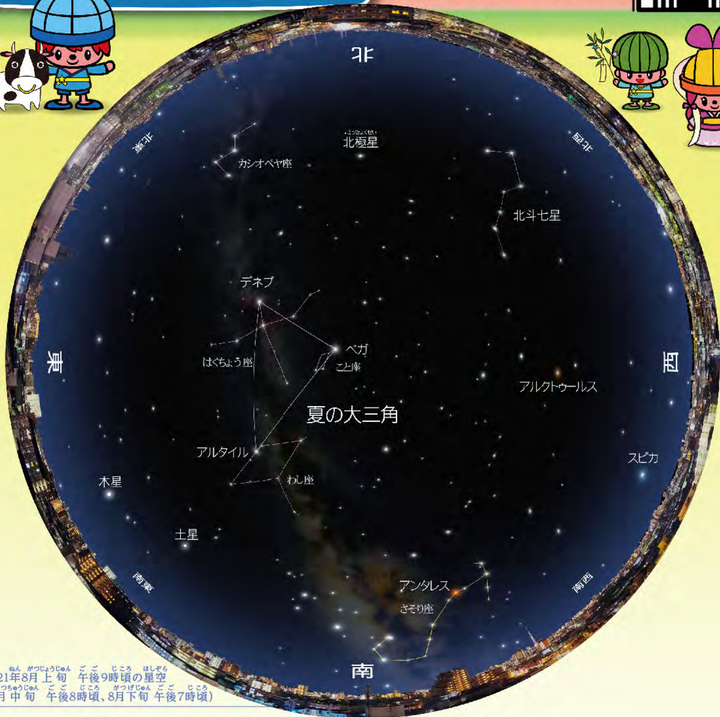
2021年8月上旬 午後9時頃の星空 (8月中旬 午後8時頃、8月下旬 午後7時頃)

街の中でも、明るい星ならきつと探することができるはず。まずは、夏の三大角を探してみましょう。 ほぼ真上に見えている明るい星がこと座のベガ。そこから星空の図をたよりに、わし座のアルタイル、はくちょう座のデネブを探します。さらに、アルクトゥールス、アンタレス、そして木星と土星も探してみましょう。 8月中旬には、この図の星たちのほかに、月も見えています。